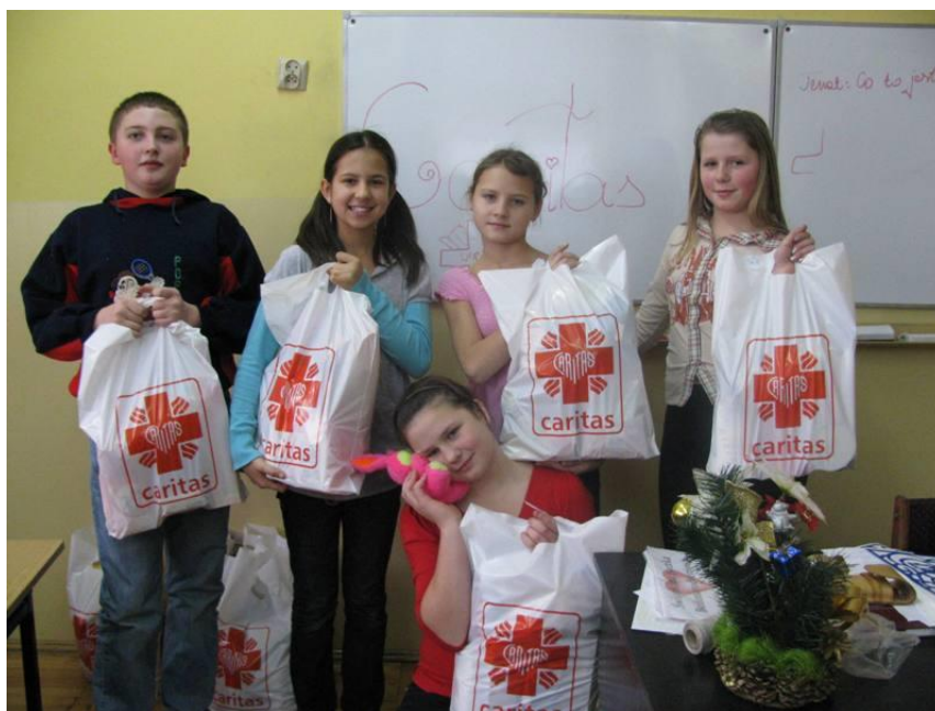
Świąteczne paczki przygotowane przez SKC

sprawiedliwie przyniesione dary i przygotowali paczki. Dla dzieci oprócz słodkości, przygotowano także maskotki, o które zatroszczyli się uczniowie naszej szkoły. Poza paczkami przygotowano także bony na zakupy przedświąteczne dla wybranych rodzin. Ich sfinansowanie było możliwe dzięki szczególnemu zaangażowaniu naszych wychowanków w przedświąteczną sprzedaż świec na stół wigilijny i opłatków przy kaplicy na Suchej. Łzy wzruszenia, jakie często towarzyszyły przekazywaniu podarunków, są dla nas wszystkich najlepszym dowodem na to, że zawsze warto dzielić się z innymi.